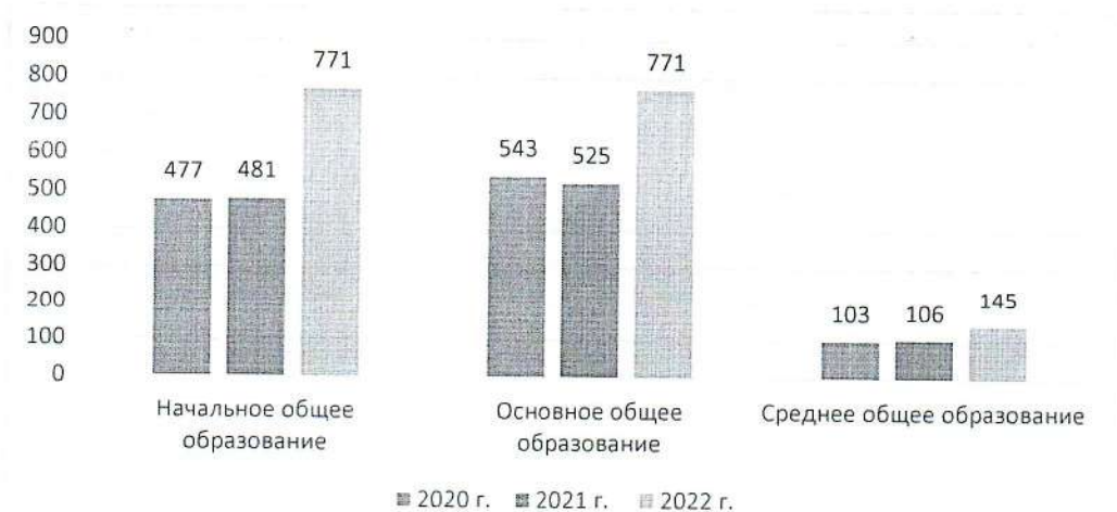
Схема 1. Динамика контингента обучающихся на 01.09. за 2020-2022 г.г.

Динамика контингента обучающихся за последние 3 года устойчива.